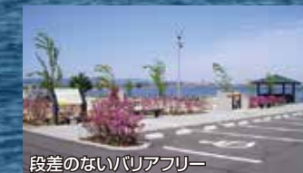
段差のないバリアフリー

新緑の季節、新元号「令和」もスタートし新しい時代が幕を開けました。大きく変化するライフスタイルの中で、お墓文化も大きく変化しています。このたび当園では、継承者のいない方も安心してご利用いただける供養施設「TOMARIGI(トマリギ)」をオープンいたしました。様々なニーズにお応えする新時代霊園、大海崎メモリアルパーク。ぜひこの機会にご相談にお立ち寄りください。