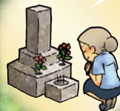
親戚のお墓の 墓守をしている。